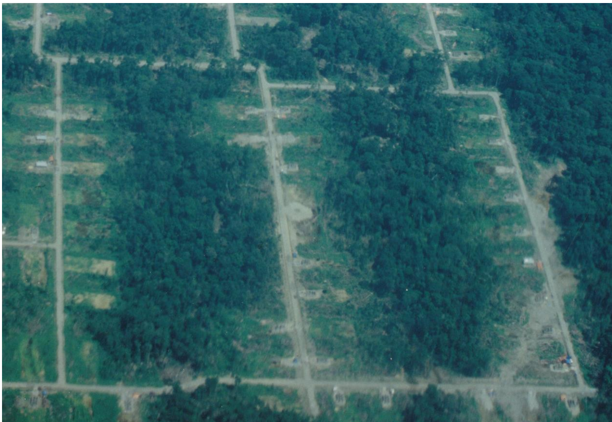
Regenwaldzerstörung: Blick auf eine der zahlreichen Siedlungen, die in Folge des