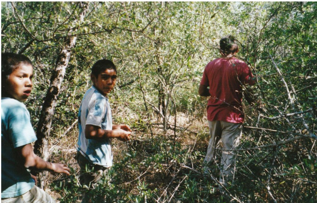
Kinder der Totobiegosode im Wald bei Chaidi

(newsmax) Der Chaco ist nach dem Amazonas die zweitgrößte Waldzone in Lateinamerika. Die Ayoreo-Totobiegosode sind Ureinwohner des paraguayischen Chaco, nomadische Sammler und Jäger. Sie wissen die Naturressourcen schonend zu nutzen. Unter den harten Bedingungen können sie nur solange überleben, wie der Wald erhalten bleibt. Angehörige der Lokalgruppe der Totobiegosode lebten zehn Jahre unfreiwillig in der evangelistischen Missionsstation der New Tribes. Dann gelang es ihnen mit Hilfe von Ethnologen, einen Teil ihres Landes in das Grundbuch eintragen zu lassen. Jetzt leben sie auf ihrem eigenen Land in zwei Dörfern "Arocojnadi" und "Chaidi" unter eigener Führung mehr oder weniger nach ihren Traditionen.