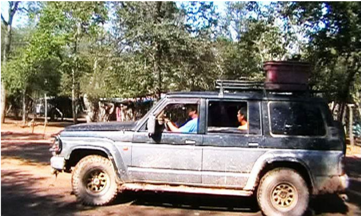
aufdrängende „Besucher“: NT-Missionare 2008 in CHAIDI, Siedlung von Ayoreos in „Erst-Kontakt“

wegen Mord an Indianern gegeben hat. Und die mennonitische Mission in Filadelfia achtet auch heute noch sehr darauf, dass die Indianer der Enlhit Christen i. S. ihrer religiösen Ansichten bleiben.